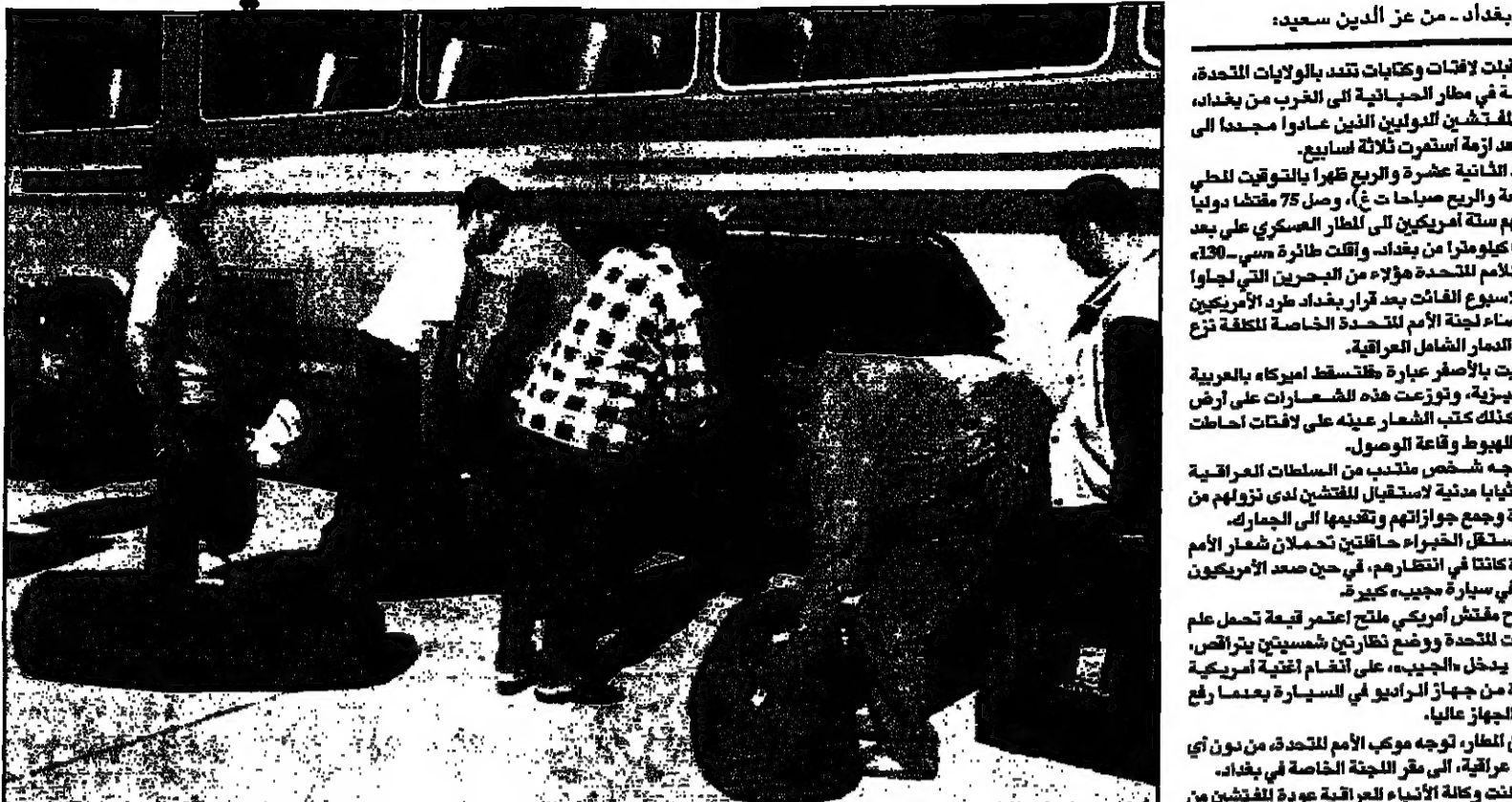
المفتشون الدوليين لدى عودتهم لبغداد الجمعة (رويترز)